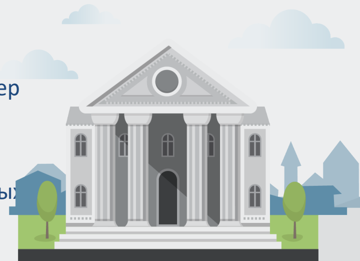
Фонд пенсионного и социального страхования РФ