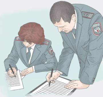
Налоговый орган, чьи акты, действия (бездействие) обжалуются