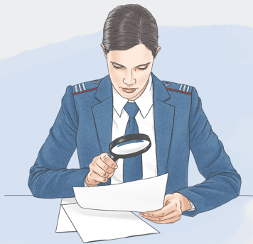
Вышестоящий налоговый орган